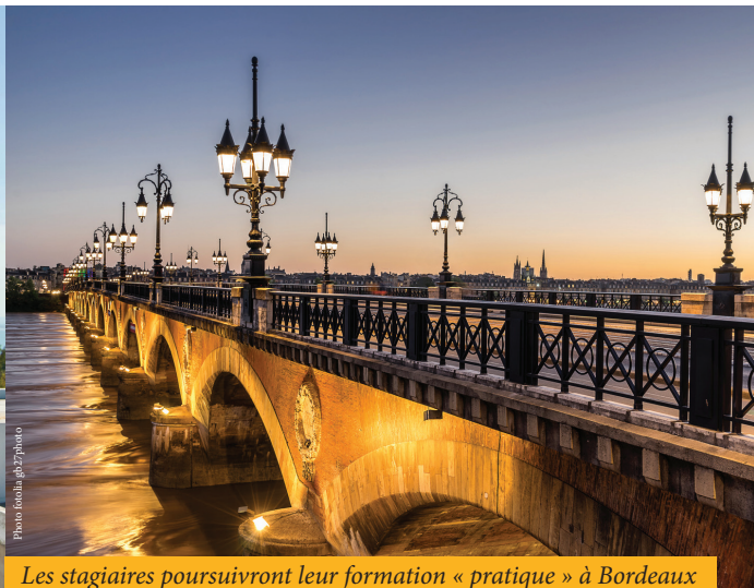
Les stagiaires poursuivront leur formation « pratique » à Bordeaux