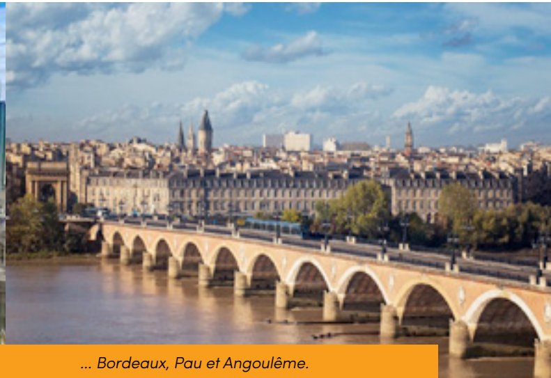
... Bordeaux, Pau et Angoulême.