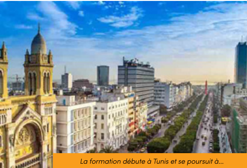
La formation débute à Tunis et se poursuit à...