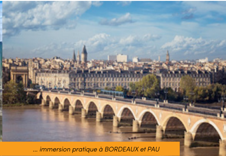
... immersion pratique à BORDEAUX et PAU