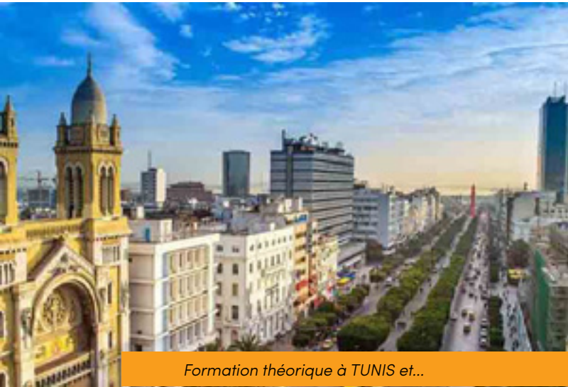
Formation théorique à TUNIS et...