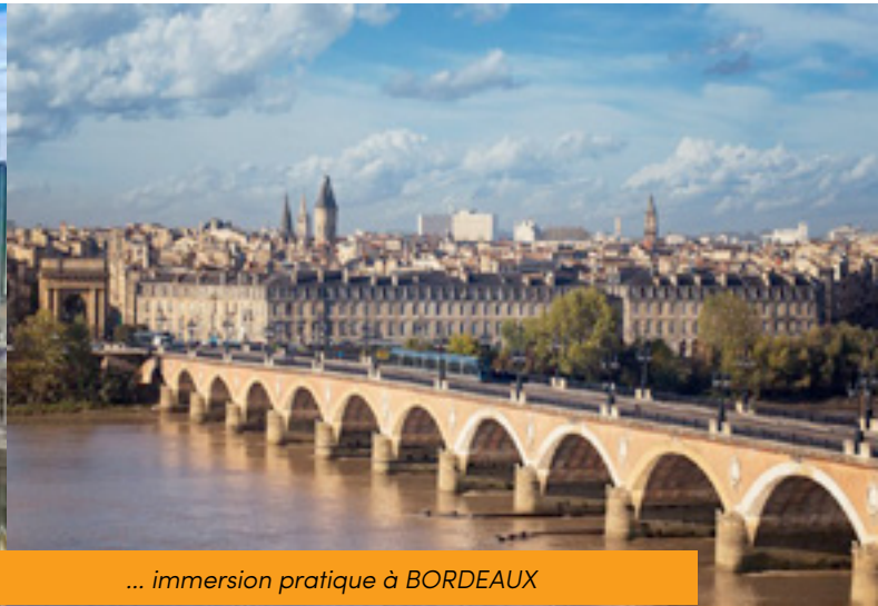
... immersion pratique à BORDEAUX